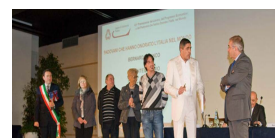
PARTECIPA AL CONCORSO: PREMIAZIONE DEL LAVORO E DEL PROGRESSO ECONOMICO